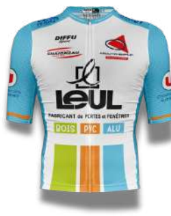
TEAM DEUX SEVRES