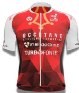
OCCITANE CYCLISME FORMATION