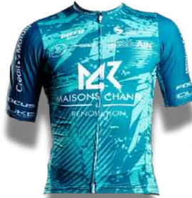
BOURG EN BRESSE AIN CYCLISME