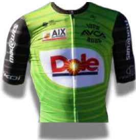
AVC AIX EN PROVENCE DOLE