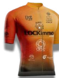
TEAM' LOCKIMMO.COM CC NOGENT-SUR-OISE