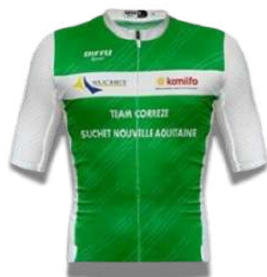
TEAM CORREZE SUCHET NOUVELLE AQUITAINE