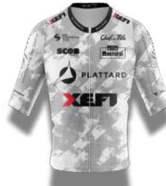
V.C. VILLEFRANCHE BEAUJOLAIS