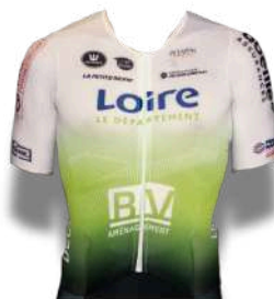
UC PELUSSIN LOIRE PILAT