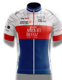
TEAM BUFFAZ GESTION DE PATRIMOINE