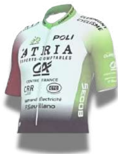
TEAM ATRIA CLERMONT