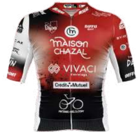
SCO DIJON TEAM MATERIEL VELO COM