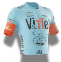
TEAM'S VITTE N'SIDE