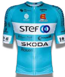
VC ROUEN 76