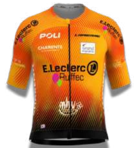
E.LECLERC RUFFEC TOP16