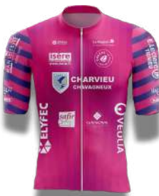
CHARVIEU CHAVAGNEUX I.C