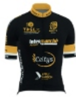
PLOUAY CYCLING TEAM