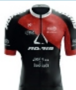
TEAM ADRIS LA CREPE DE BROCELIANDE - BLC