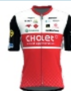
UC CHOLET 49