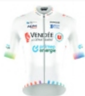
VENDÉE U - PAYS DE LA LOIRE