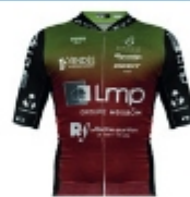
TEAM LMP - LA ROCHE VENDEE CYCLISME