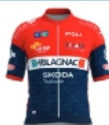
GSC BLAGNAC VC 31