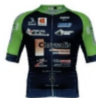
TEAM BRICQUEBEC COTENTIN