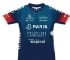
PARIS CYCLISTE OLYMPIQUE