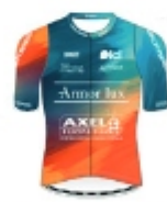
SPORTBREIZH AXEL ARMOR-LUX