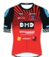
MORLAIX CYCLISME PERFORMANCE