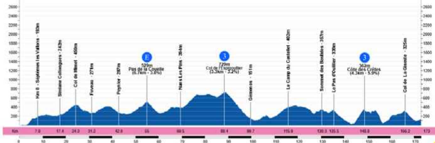
MARSEILLE - LUMINY 144m