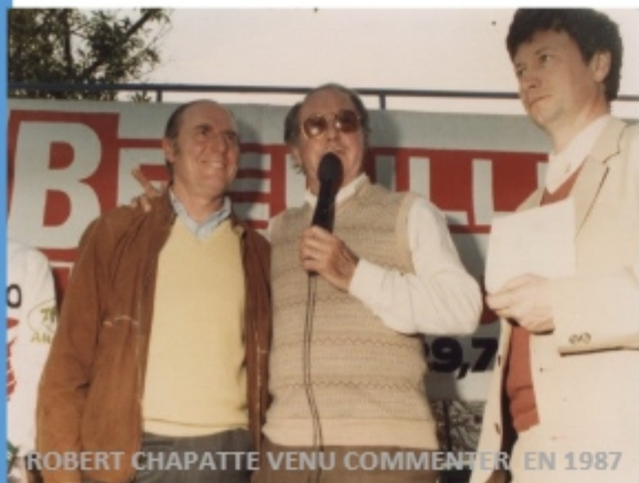
ROBERT CHAPATTE VENU COMMENTER EN 1987

Ville historique de l'essor basque Cambo se devait de fêter le cinquantenaire de l'épreuve .Avec le concours de la municipalité une grande journée anniversaire aura lieu le 24janvier prochain .Une exposition sur le cyclisme à Cambo et sur les nombreuses étapes de l'essor organisées dans la cité thermale .N'oublions pas que Cambo a été le théâtre d'un départ d'étape du tour de France en 2006 .Une projection retraçant les 50 ans de l'essor basque aura lieu dans la salle de cinéma .De nombreux champions passés par l'essor basque seront présent .