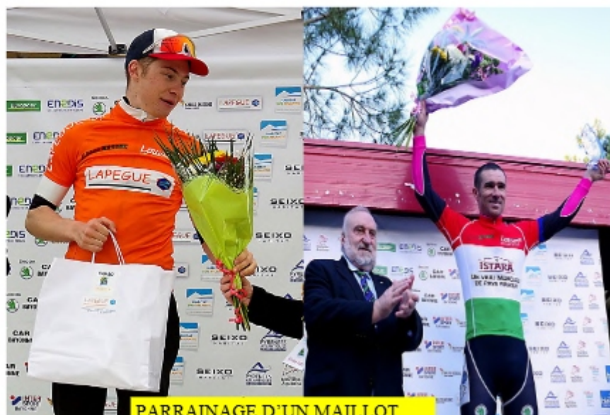
PARRAINAGE D'UN MAILLOT

Etre visible sur la cote comme à l'intérieur du pays basque et profiter des retombées valorisantes en terme d'image , le cyclisme reste un sport populaire comme en témoigne chaque année le tour de France