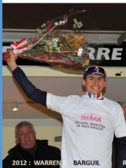
2012 : WARREN BARGUIL

Mauléon a aussi eu la chance de vibrer pour le champion le plus populaire de Soule , Marcel Quéheille que l'on surnomma le diable rouge de Sauguis , son village natal tout proche de Mauléon . Son exploit accompli à l'arrivée du tour de France 1959 à Bayonne avait soulevé l'enthousiasme de ses supporters , le petit grimpeur souletin avait devancé tous les sprinters sur une étape plate ( Bordeaux Bayonne) .Un phénomène ce Marcel Quéheille , le tempérament d'un vrai souletin capable de soulever des montagnes !