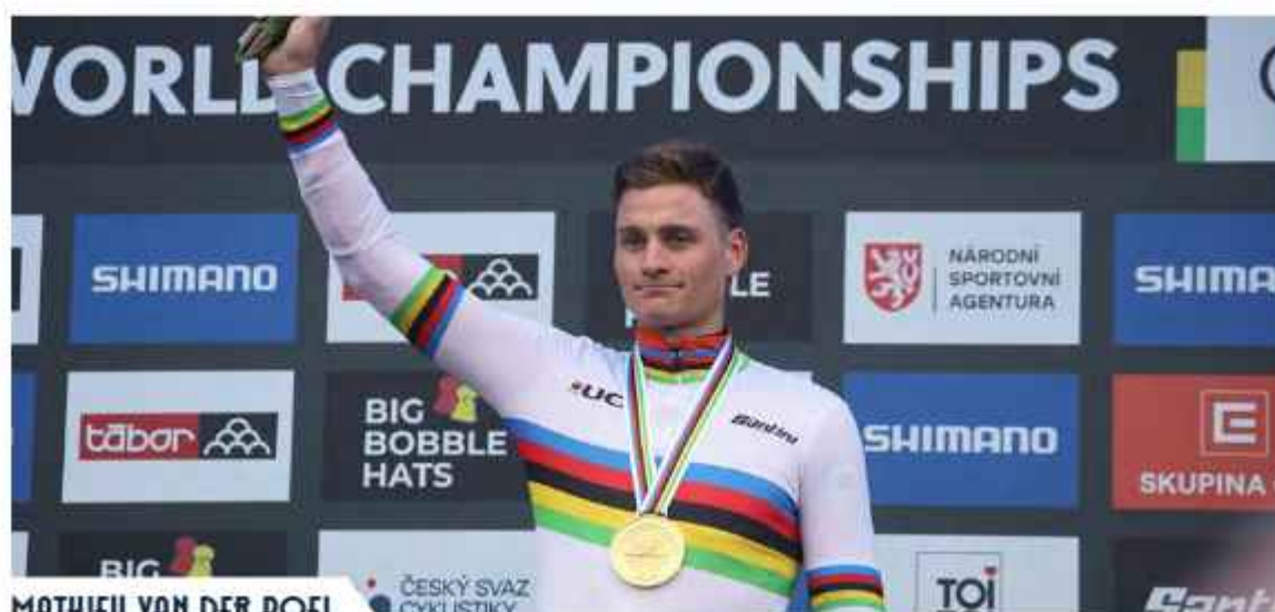
MATHIEU VAN DER POEL