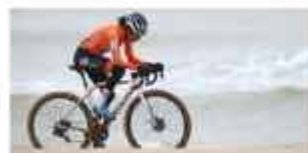
Ceylin ALVARADO 🇳🇱

réaliser de formidables remontées, compensant par des qualités physiques extraordinaires. Elle fut Championne du Monde UCI en 2021 – et 3 fois 2ème, 3 fois 3ème.