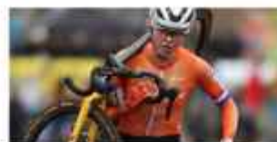
Fem VAN EMPEL

Née le 3 septembre 2002. À seulement 22 ans, la déjà double Championne du Monde UCI (et tenante du titre) est venue au sport par le foot, qu'elle a pratiqué jusqu'à ses 15 ans. En conséquence, elle va très vite à pied – et une bonne foulée, c'est aussi une foulée économe. De quoi préserver ses énormes capacités de puissance. Les bons jours, Van Empel met en route au fil des tours, use ses adversaires jusqu'à les faire craquer.