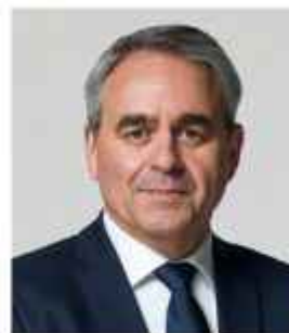
XAVIER BERTRAND PRÉSIDENT DE LA RÉGION HAUTS-DE-FRANCE

La Région vous donne rendez-vous à Liévin, du 31 janvier au 2 février 2025, pour vivre ensemble ce moment historique. Faisons des Championnats du Monde Cyclo-cross UCI une réussite qui restera gravée dans nos mémoires et continuons de montrer aux yeux du monde entier que les Hauts-de-France sont définitivement une terre de sport où tous les exploits sont possibles.