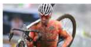
Mathieu VAN DER POEL 🇳🇱

Né le 19 janvier 1996 à Kapellen (Belgique). On ne le présente plus. Fils d'Adri Van der Poel, petit-fils de Raymond Poulidor, « MVDP » est une star internationale, un athlète spectaculaire, un immense champion en somme, vainqueur des courses sur route les plus prestigieuses (Champion du Monde UCI, vainqueur de Milan-