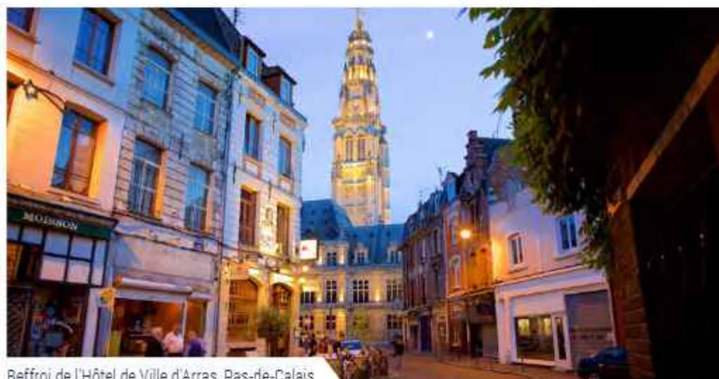
Beffroi de l'Hôtel de Ville d'Arras, Pas-de-Calais