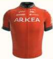
ARKEA - B&B HOTELS WOMEN