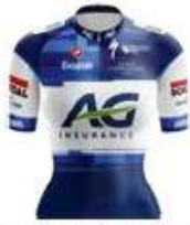
AG INSURANCE SOUDAL NXTG