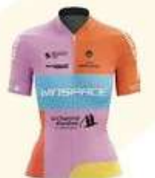
WINSPACE WOMEN CYCLING TEAM