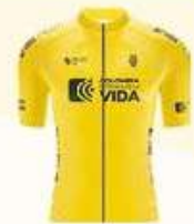
COLOMBIA POTENCIA DE LA VIDA