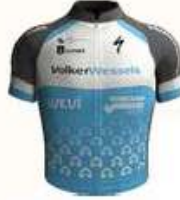
VOLKERWESSELS WOMEN'S PRO CYCLING TEAM