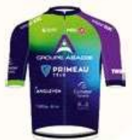
PRIMEAU VÉLO GROUPE ABADIE