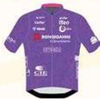
BE PINK BONGIOANNI