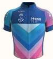
HESS CYCLING TEAM