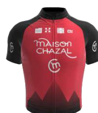
TEAM FÉMININ CHAMBERY