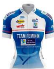
TEAM CENTRE VAL DE LOIRE