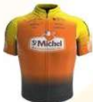
SAINT MICHEL - MAVIC AUBER 93