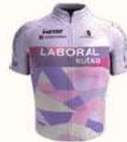
LABORAL KUTXA FUNDACION EUSKADI