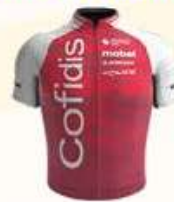
COFIDIS WOMEN TEAM