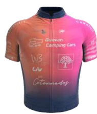
LANESTER WOMEN MORBIHAN