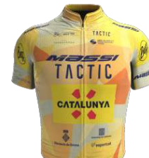
MASSI BAIX TER