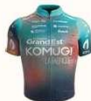
TEAM KOMUGI GRAND EST