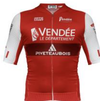
LADIES VENDÉE PIVETEAU BOIS