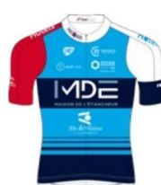
TEAM VERN 35