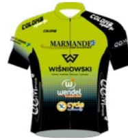
MARMANDE WOMEN DÉVELOPPEMENT