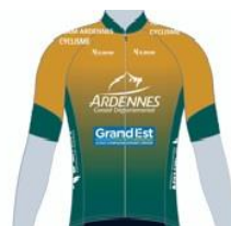
TEAM ARDENNES CYCLISME