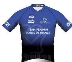
TEAM FÉMININ HAUTS-DE-FRANCE