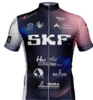
TEAM AVESNOIS FÉMININ