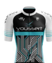
VCESQY TEAM VOUSPERT