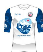
TEAM PRAZ SUR ARLY HAUTE-SAVOIE