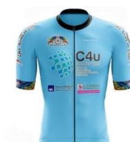
DES ROUES EN ELLES