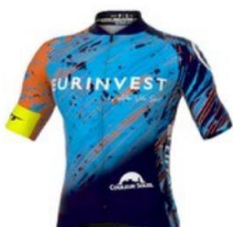
EURINVEST BY ALBI VELO SPORT