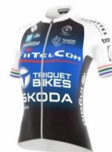
ENTENTE CYCLISTE THAONNAISE