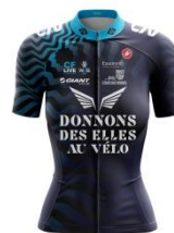
DONNONS DES ELLES AU VÉLO ÉVRY COURCOURONNES