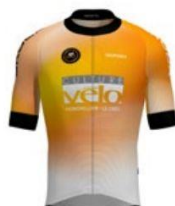
TEAM VCM URBANBIKE