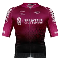
ABUS - SPRINTEUR CLUB FÉMININ