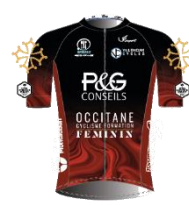
OCCITANE CYCLISME FORMATION