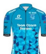
TEAM OZARM STAMINA L'ISLE SUR LA SORGUE