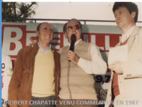
ROBERT CHAPATTE VENU COMMENTER EN 1987