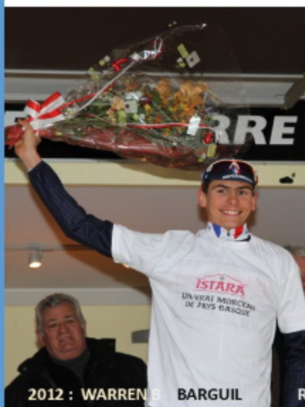
2012 : WARREN BARGUIL

Mauléon a aussi eu la chance de vibrer pour le champion le plus populaire de Soule , Marcel Quéheille que l'on surnomma le diable rouge de Sauguis , son village natal tout proche de Mauléon . Son exploit accompli à l'arrivée du tour de France 1959 à Bayonne avait soulevé l'enthousiasme de ses supporters , le petit grimpeur souletin avait devancé tous les sprinters sur une étape plate ( Bordeaux Bayonne) .Un phénomène ce Marcel Quéheille , le tempérament d'un vrai souletin capable de soulever des montagnes !