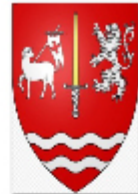
SAINT JEAN LE VIEUX