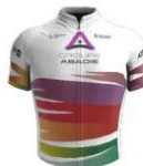
Team Groupe Abadie