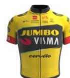
Team Jumbo Visma