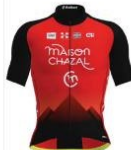
Team Féminin Chambéry