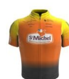
Saint Michel Mavic - Auber 93