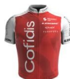
Cofidis Women Team