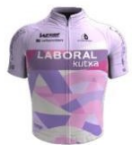
Laboral Kutxa Fundacion Euskadi