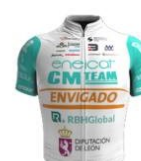
Eneicat RBH Global