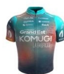
Team Grand Est Komugi - La Fabrique