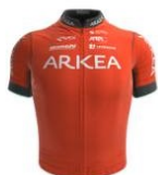
Arkéa Pro Cycling Team