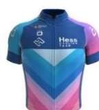
Hess Cycling Team