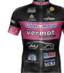
VC Morteau Montbenoit