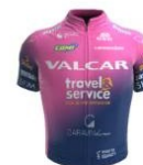
Valcar Travel & Service