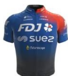
FDJ - Suez Futuroscope