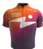
Human Powered Health