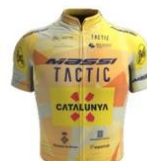
Massi Tactic Women's Team