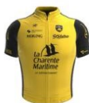
Stade Rochelais Charente Maritime