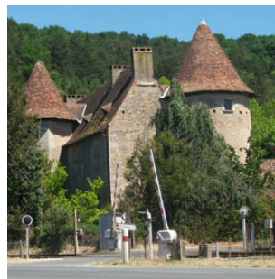
Château de Perdigat