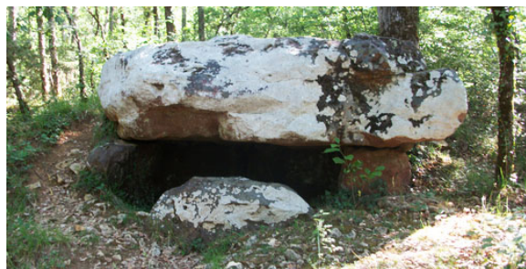
Dolmen de Cantagrel

Le circuit adapté en 2022 au cahier des charges régional est reconduit.