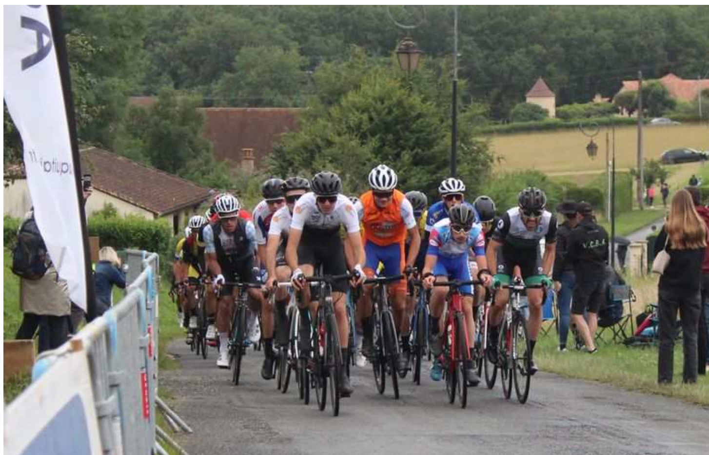
Passage Championnats NOAQ 2022

St Chamassy (24) 25 Juin 2023 ---- Départ à 14 heures