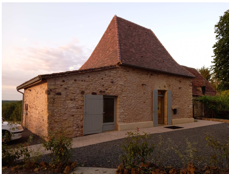
La maison du bourg à proximité du départ / arrivée

La permanence a lieu à la maison du bourg de St Chamassy et sera ouverte à partir de 12 h 30