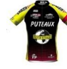
C.S.M. PUTEAUX CYCLISME