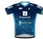
TEAM ELLES - GROUPAMA - PAYS DE LA LOIRE