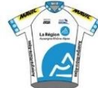
TEAM FÉMININ AUVERGNE-RHÔNE-ALPES