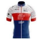
LYON SPRINT EVOLUTION