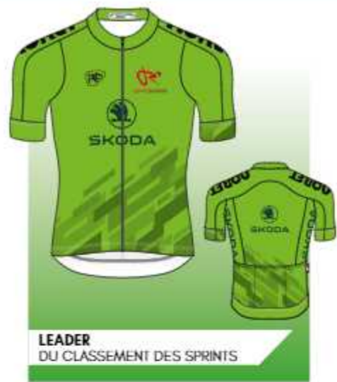
LEADER DU CLASSEMENT DES SPRINTS