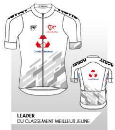
LEADER DU CLASSEMENT MEILLEUR JEUNE