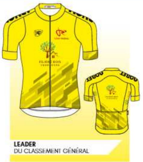
LEADER DU CLASSEMENT GÉNÉRAL