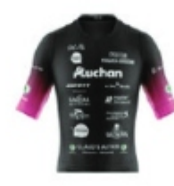
CYCLO CLUB PERIGUEUX DORDOGNE