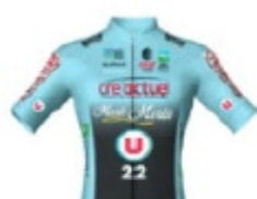
COTES D'ARMOR MARIE MORIN U