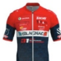
GSC BLAGNAC VS31