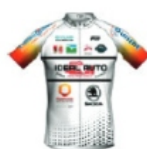
DINAN SPORT CYCLING