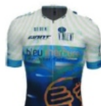
U.C. BRIOCHINE BLEU MERCURE