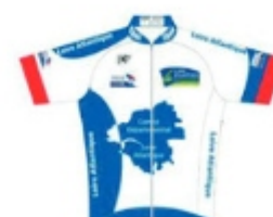
COMITE DEP 44