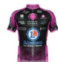
LES SABLES VENDEE CYCLISME