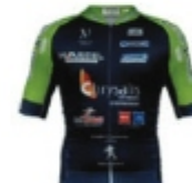
TEAM BRICQUEBEC COTENTIN**