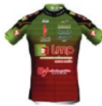
TEAM LMP - LA ROCHE SUR YON VENDEE CYCLISME