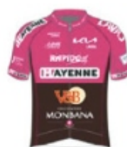
LAVAL CYCLISME 53