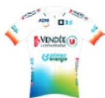
VENDEE U PAYS DE LA LOIRE