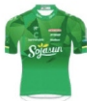
SOJASUN ESPIRIT AC NOYAL CHATILLON