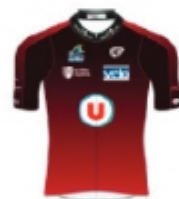
TEAM U CHARENTE MARITIME