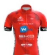
ANTWERP CYCLING TEAM