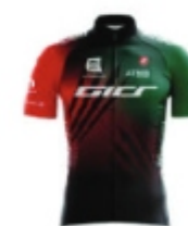
US STE AUSTREBERTHE PAVILLY BARENTIN