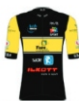
UNION SPORTIVE SAINT HERBLAIN