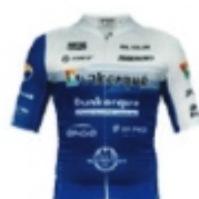
DUNKERQUE GRAND LITTORAL CYCLISME*