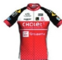
UC CHOLET 49