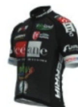
OCEANE TOP 16