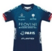
PARIS CYCLISTE OLYMPIQUE