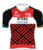
VC DU PAYS DE LOUDEAC