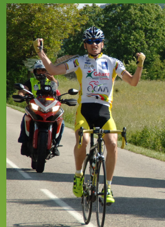
GUIDE DE ROUTE