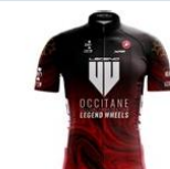
OCF TEAM LEGEND WHEELS