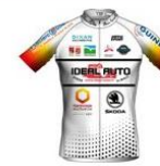
DINAN SPORT CYCLING