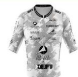
VELO CLUB VILLEFRANCHE BEAUJOLAIS