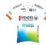
VENDEE U PAYS DE LA LOIRE