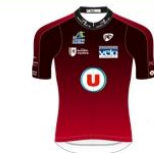
TEAM U CHARENTE MARITIME