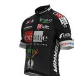
OCEANE TOP 16