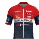
GSC BLAGNAC VS31