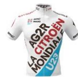
CHAMBERY CYCLISME FORMATION