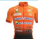
CC ETUPES LE DOUBS PAYS DE MONTBELIARD