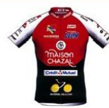
SCO DIJON TEAM MATERIEL-VELO.COM