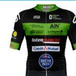
BOURG EN BRESSE AIN CYCLISME