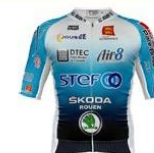
VELOCE CLUB ROUEN - 76