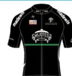
AVC AIX EN PROVENCE