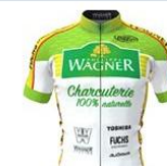
PHILIPPE WAGNER CYCLING