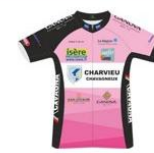
CHARVIEU CHAVAGNEUX ISERE CYCLISME