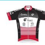
CC NOGENT SUR OISE