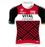
VC DU PAYS DE LOUDEAC