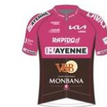
MAYENNE-V AND B- MONBANA