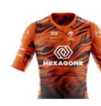
HEXAGONE - CORBAS LYON METROPOLE