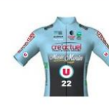
COTES D'ARMOR MARIE MORIN U