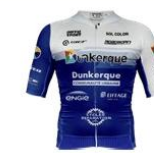
DUNKERQUE GRAND LITTORAL CYCLISME