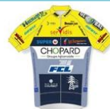
AMICALE CYCLISTE BISONTINE