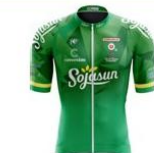
SOJASUN ESPOIR AC NOVAL CHATILLON