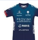
PARIS CYCLISTE OLYMPIQUE