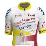
EC ST ETIENNE LOIRE