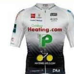
VÉLO CLUB VAULX EN VELIN