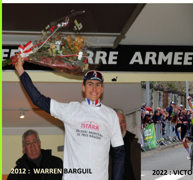
2012 : WARREN BARGUIL

Mauléon a aussi eu la chance de vibrer pour le champion le plus populaire de Soule , Marcel Quéheille que l'on surnomma le diable rouge de Sauguis , son village natal tout proche de Mauléon . Son exploit accompli à l'arrivée du tour de France 1959 à Bayonne avait soulevé l'enthousiasme de ses supporters , le petit grimpeur souletin avait devancé tous les sprinters sur une étape plate ( Bordeaux Bayonne) .Un phénomène ce Marcel Quéheille , le tempérament d'un vrai souletin capable de soulever des montagnes !