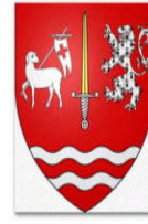
SAINT JEAN LE VIEUX