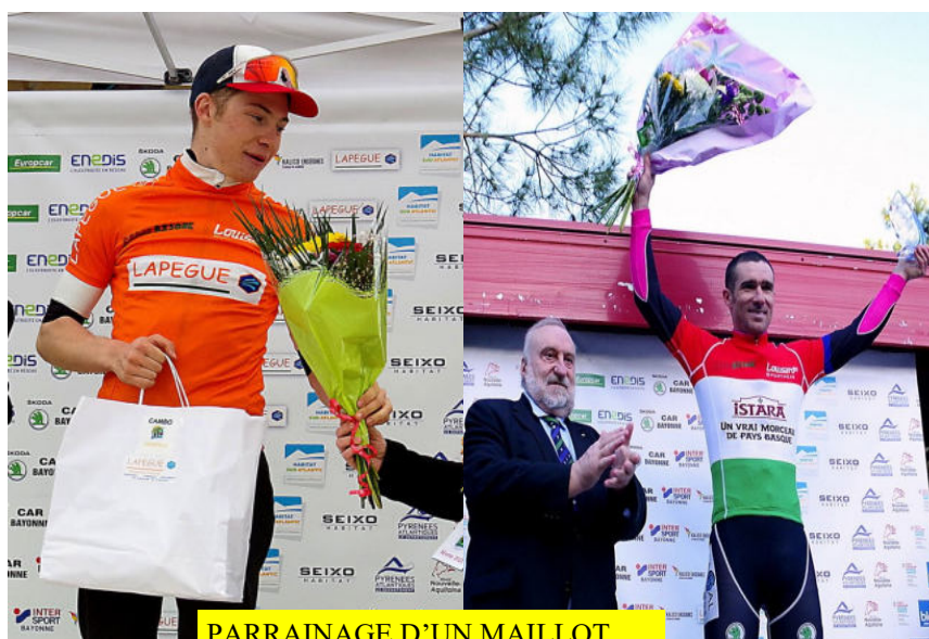
PARRAINAGE D'UN MAILLOT

Etre visible sur la cote comme à l'intérieur du pays basque et profiter des retombées valorisantes en terme d'image , le cyclisme reste un sport populaire comme en témoigne chaque année le tour de France