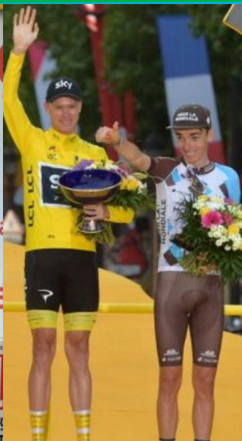
ROMAIN BARDET SUR LE PODIUM DU TOUR