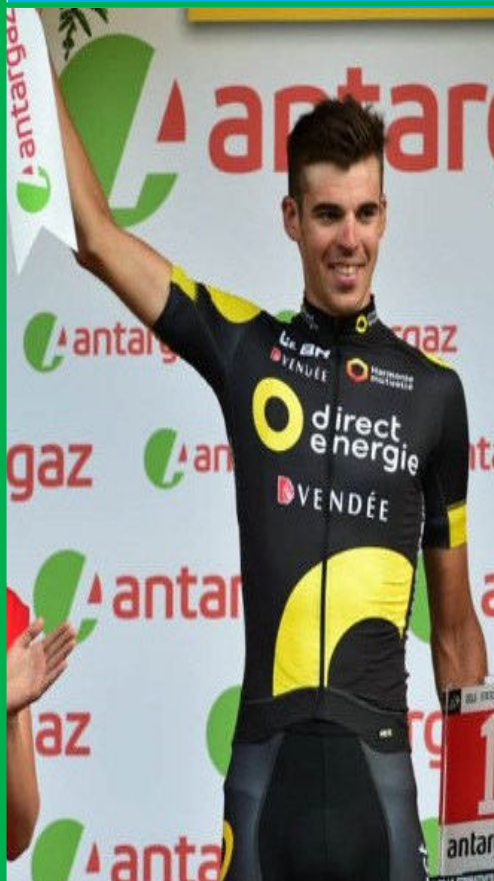
LILIAN CALMEJANE REVELATION DU TOUR 2017