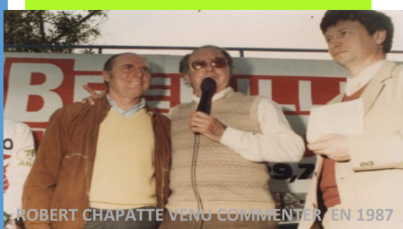
ROBERT CHAPATTE VENU COMMENTER EN 1987