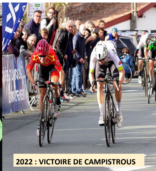
2022 : VICTOIRE DE CAMPISTROUS