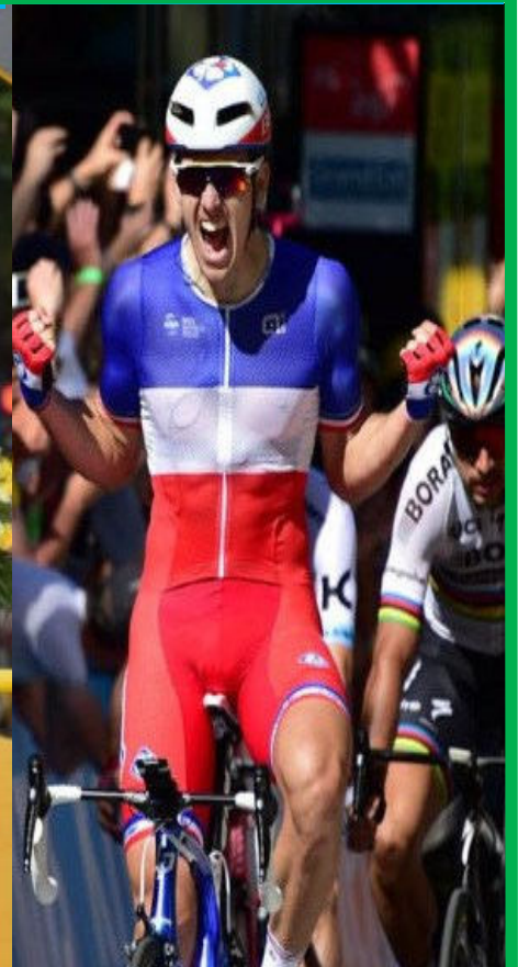
ARNAUD DEMARE VAINQUEUR DE L'ETAPE DE VITTEL DU TOUR 2017