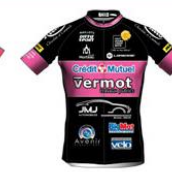
VC MORTEAU MONTEBENOIT

L'organisateur est libre d'inviter toutes équipes féminines françaises ou étrangères, dont la participation est fonction du genre de l'épreuve.