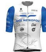
SPRINTER NICE METROPOLE