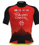
TEAM FÉMININ CHAMBÉRY