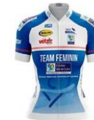
TEAM CENTRE VAL DE LOIRE FÉMININ