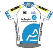
TEAM FÉMININ AUVERGNE-RHÔNE-ALPES