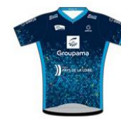
TEAM ELLES - GROUPAMA PAYS DE LA LOIRE