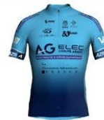
TEAM GROUPE ABADIE LE BOULOU