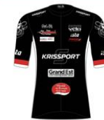
TEAM MACADAM'S COWBOYS