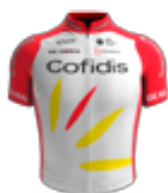
UCI WORLD TEAM COFIDIS FRA