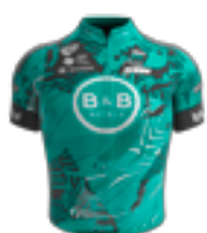
UCI PRO TEAM B&B HOTELS P/B KTM FRA