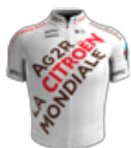
UCI WORLD TEAM AG2R CITROËN TEAM FRA