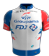
UCI WORLD TEAM GROUPAMA - FDJ FRA