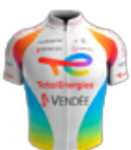
UCI PRO TEAM TOTALENERGIES FRA