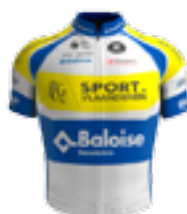
UCI PRO TEAM SPORT VLAANDEREN - BALOISE BEL