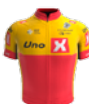
UCI PRO TEAM UNO - X PRO CYCLING TEAM NOR