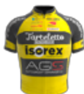
EQUIPE CONTINENTALE UCI TARTELETTO - ISOREX BEL