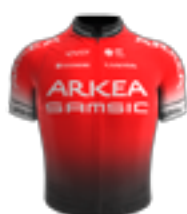
UCI PRO TEAM TEAM ARKEA - SAMSIC FRA