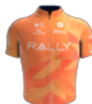
UCI PRO TEAM RALLY CYCLING USA