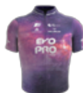
EQUIPE CONTINENTALE UCI EVOPRO RACING IRL