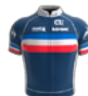
EQUIPE NATIONALE ÉQUIPE DE FRANCE FRA