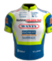
UCI WORLD TEAM INTERMARCHÉ - WANTY - GOBERT MATÉRIAUX BEL