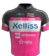
EQUIPE CONTINENTALE UCI XELLISS - ROUBAIX LILLE METROPOLE FRA