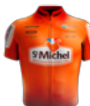
EQUIPE CONTINENTALE UCI ST MICHEL - AUBER 93 FRA