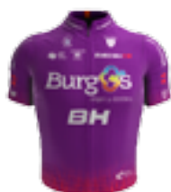
UCI TEAM BURGOS-BH ESP