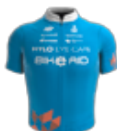
EQUIPE CONTINENTALE UCI BIKE AID GER