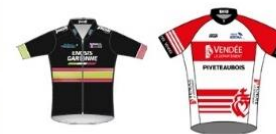
ENOSIS GARONNE - ENTENTE MARMANDE MERIGNAC LADIES VENDÉE PIVETEAU BOIS