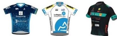
TEAM ELLES - GROUPAMA - PAYS DE LA LOIRE TEAM FÉMININ AUVERGNE-RHÔNE-ALPES TEAM FÉMININ LE BOULOU