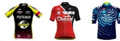
C.S.M. PUTEAUX CYCLISME CHAMBÉRY CYCLISME FORMATION CO COURCOURONNES CYCLISME FÉMININ