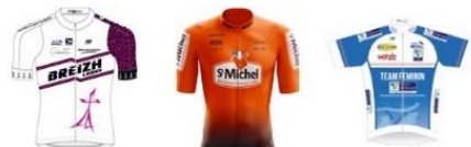
BREIZH LADIES SAINT MICHEL AUBER 93 TEAM CENTRE VAL DE LOIRE FÉMININ