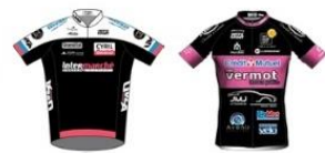
UVCA TROYES VC MORTEAU MONTBENOIT