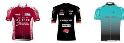
TEAM ALIENOR NOUVELLE-AQUITAINE TEAM MACADAM'S COWBOYS VÉLO CLUB ISLOIS TEAM STAMINA