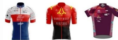
LYON SPRINT EVOLUTION OCCITANE CYCLISME FORMATION FÉMININ SPRINTEUR CLUB FÉMININ