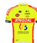
BINGOAL-WB LADIES (BEL)