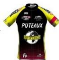
C.S.M. PUTEAUX CYCLISME