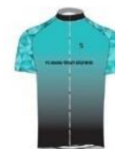
VÉLO CLUB ISLOIS TEAM STAMINA

L'organisateur est libre d'inviter toutes équipes féminines françaises ou étrangères, dont la participation est fonction du genre de l'épreuve.