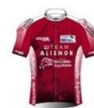
TEAM ALIENOR NOUVELLE-AQUITAINE