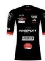
TEAM MACADAM'S COWBOYS