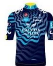
CO COURCOURONNES CYCLISME FÉMININ