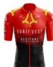
OCCITANE CYCLISME FORMATION FÉMININ