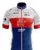
LYON SPRINT ÉVOLUTION