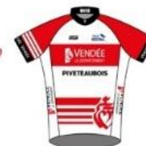
LADIES VENDÉE PIVETEAU BOIS