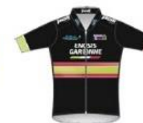
ENOSIS GARONNE - ENTENTE MARMANDE MERIGNAC