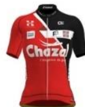
CHAMBÉRY CYCLISME FORMATION