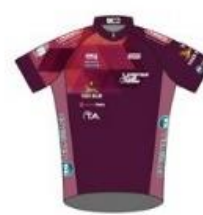
SPRINTEUR CLUB FÉMININ