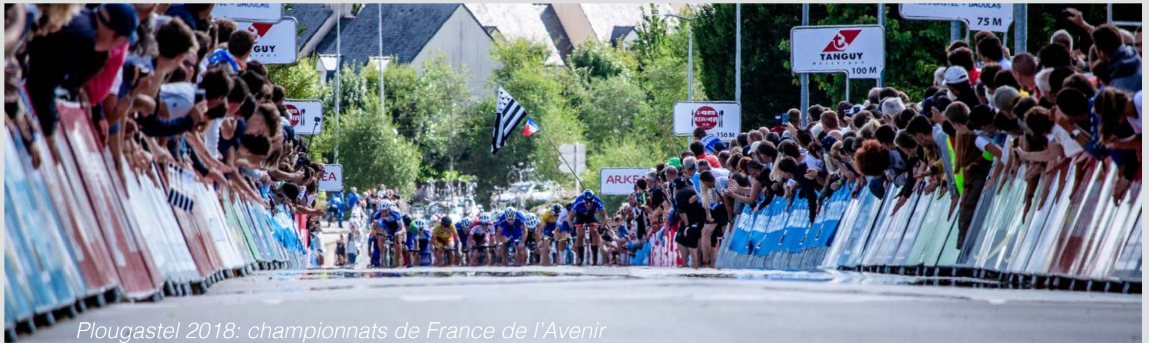
Plougastel 2018: championnats de France de l'Avenir