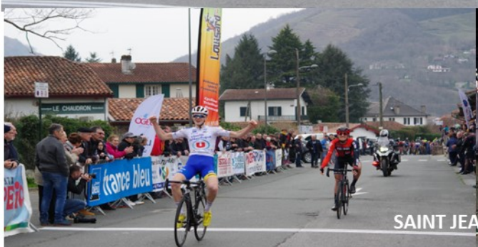
SAINT JEAN PIED DE PORT