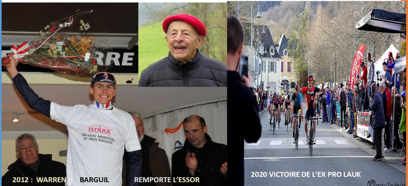
2012 : WARREN BARGUIL

Mauléon a aussi eu la chance de vibrer pour le champion le plus populaire de Soule , Marcel Quéheille que l'on surnomma le diable rouge de Sauguis , son village natal tout proche de Mauléon . Son exploit accompli à l'arrivée du tour de France 1959 à Bayonne avait soulevé l'enthousiasme de ses supporters , le petit grimpeur souletin avait devancé tous les sprinters sur une étape plate ( Bordeaux Bayonne) .Un phénomène ce Marcel Quéheille , le tempérament d'un vrai souletin capable de soulever des montagnes !