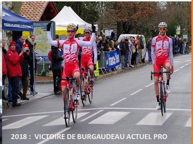
2018 : VICTOIRE DE BURGAUDEAU ACTUEL PRO