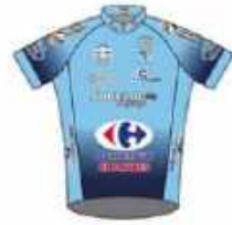
C'C CHARTRES CYCLISME