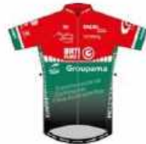
US STE AUSTREBERTHE PAVILLY BARENTIN