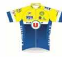
UNION VÉLOCIPÉDIQUE DE LIMOGES - TEAM U 87