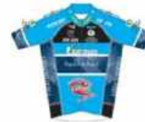
MARTIGUES SPORT CYCLISME