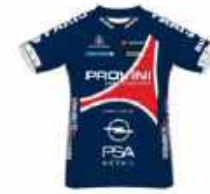
PARIS CYCLISME OLYMPIQUE