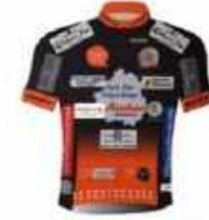
CYCLO CLUB PÉRIGUEUX DORDOGNE