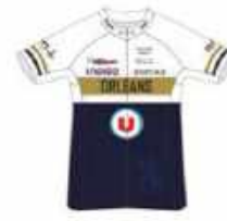
ORLÉANS LOIRET CYCLISME