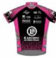
LES SABLES VENDÉE CYCLISME