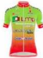
LA ROCHE SUR YON VENDÉE CYCLISME