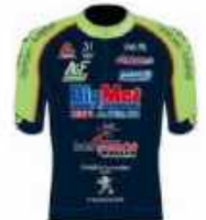
TEAM BRICQUEBEC COTENTIN