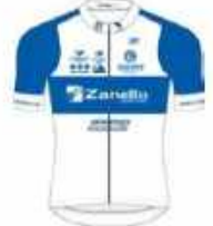
ES TORIGNI CYCLISME