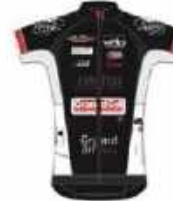
TEAM MACADAM'S COWBOY