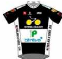
VC VAULX EN VELIN