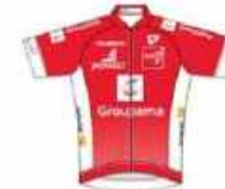
VÉLO SPORT VALLETAIS