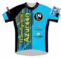
TEAM CYCLISTE AZURÉEN