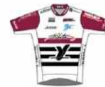
VÉLO CLUB DE TOUCY