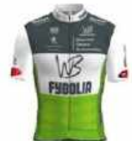
WB FYBOLIA LOCMINÉ