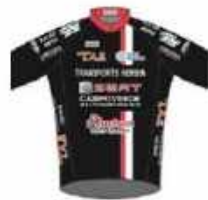
VCA ST QUENTIN