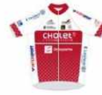
UNION CYCLISTE CHOLET 49