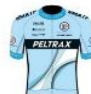
TEAM PELTRAX - CSD