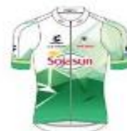
SOJASUN ESPOIR ACNC