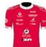
VELO CLUB VILLEFRANCHE BEAUJOLAIS