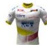
EC ST ETIENNE LOIRE