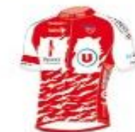
VENDEE U PAYS DE LA LOIRE