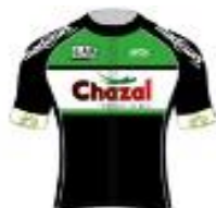
AVC AIX EN PROVENCE