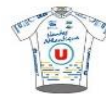
UC NANTES ATLANTIQUE