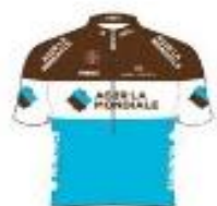
CHAMBERY CYCLISME FORMATION