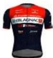
CSC BLAGNAC - VS 31