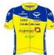
CR4 CHEMINS ROANNE