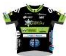
BOURG EN BRESSE AIN CYCLISME