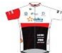
CC NOGENT SUR OISE