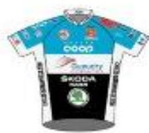
VC ROUEN 76