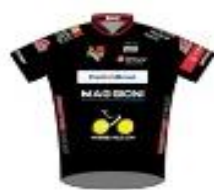
SCO DIJON TEAM MATÉRIEL VELO.COM