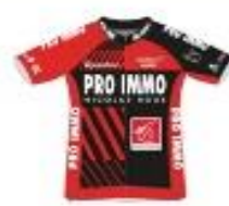
VCCA TEAM PRO IMMO NICOLAS ROUX