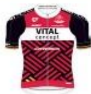
VC PAYS DE LOUDEAC