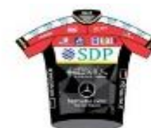
CC VILLENEUVE ST GERMAIN SOISSONS AISNE