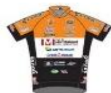
CC ETUPES LE DOUBS PAYS DE MONTBELIARD