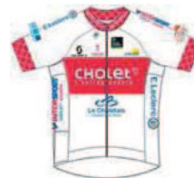
UNION CYCLISTE CHOLET 49