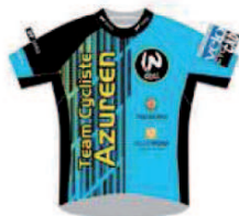
TEAM CYCLISTE AZUREEN