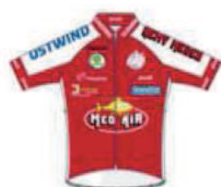
PE HAGUENAU - TEAM REMY MEDER