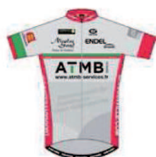
USSA PAVILLY BARENTIN