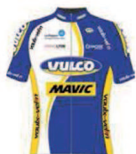
VELO CLUB VAULX EN VELIN TEAM VULCO