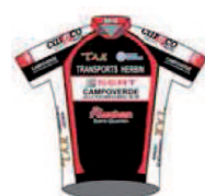
VCA ST QUENTIN