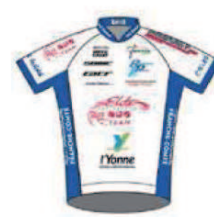
VELO CLUB DE TOUCY ELITE RESTAURATION