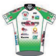
TEAM PAYS DE DINAN