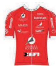
VC VILLEFRANCHE BEAUJOLAIS