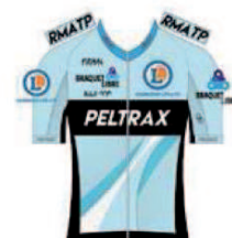
TEAM PELTRAX - CSD