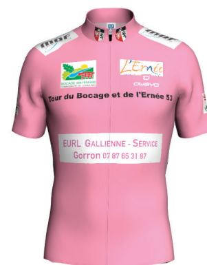
Maillot du vainqueur de l'étape de Saint Berthevin la Tannière

Suivez sur notre page Facebook : Le Tour du Bocage et de L'Ernée 53