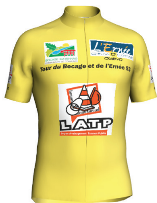
Maillot de leader