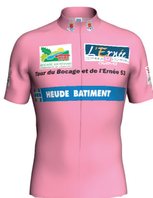
Maillot vainqueur de l'étape de Chailland