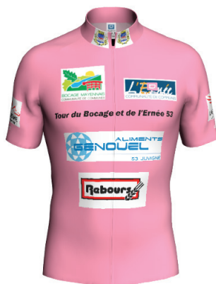
Maillot du vainqueur de l'étape de Saint Loup du Gast