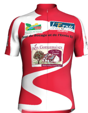
Maillot KM 53