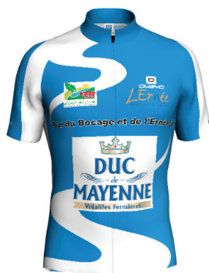
Maillot 1 re équipe