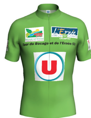
Maillot points chauds