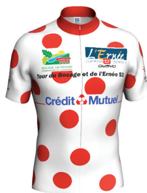
Maillot meilleur grimpeur