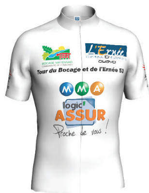
Maillot meilleur junior 1 re année